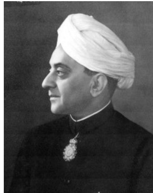
സർ സി. പി. രാമസ്വാമി

മൃഗചികിത്സയും കന്നുകാലി സമ്മേളനത്തെക്കുറിച്ചുള്ള വാർത്തയും ഉണ്ട്. തേൻവ്യവസായവും അരക്കു വ്യവസായവും മുട്ടക്കച്ചവടത്തിലെ നവീന പ്രവണതകളും, കുടിൽ വ്യവസായത്തിലെ പ്രശ്നങ്ങളും അഭിവൃദ്ധി പദ്ധതികളും കയർ വ്യവസായം തുടങ്ങി പരമ്പരാഗത വ്യവസായങ്ങളുടെ ഉദ്ധാരണ പദ്ധതികൾ കൃഷിവ്യവസായസാധ്യതകൾ എന്നിവയും വിപുലമായി വിഷയമാകുന്നുണ്ട്. നസ്രാണി ദിപികയിൽ വന്ന കടലാസ് വ്യവസായത്തെക്കുറിച്ചുള്ള കുറിപ്പും നൽകിയിട്ടുണ്ട്.