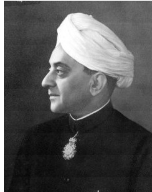
സർ സി. പി. രാമസ്വാമി

മൃഗചികിത്സയും കന്നുകാലി സമ്മേളനത്തെക്കുറിച്ചുള്ള വാർത്തയും ഉണ്ട്. തേൻവ്യവസായവും അരക്കു വ്യവസായവും മുട്ടക്കച്ചവടത്തിലെ നവീന പ്രവണതകളും, കുടിൽ വ്യവസായത്തിലെ പ്രശ്നങ്ങളും അഭിവൃദ്ധി പദ്ധതികളും കയർ വ്യവസായം തുടങ്ങി പരമ്പരാഗത വ്യവസായങ്ങളുടെ ഉദ്ധാരണ പദ്ധതികൾ കൃഷിവ്യവസായസാധ്യതകൾ എന്നിവയും വിപുലമായി വിഷയമാകുന്നുണ്ട്. നസ്രാണി ദിപികയിൽ വന്ന കടലാസ് വ്യവസായത്തെക്കുറിച്ചുള്ള കുറിപ്പും നൽകിയിട്ടുണ്ട്.